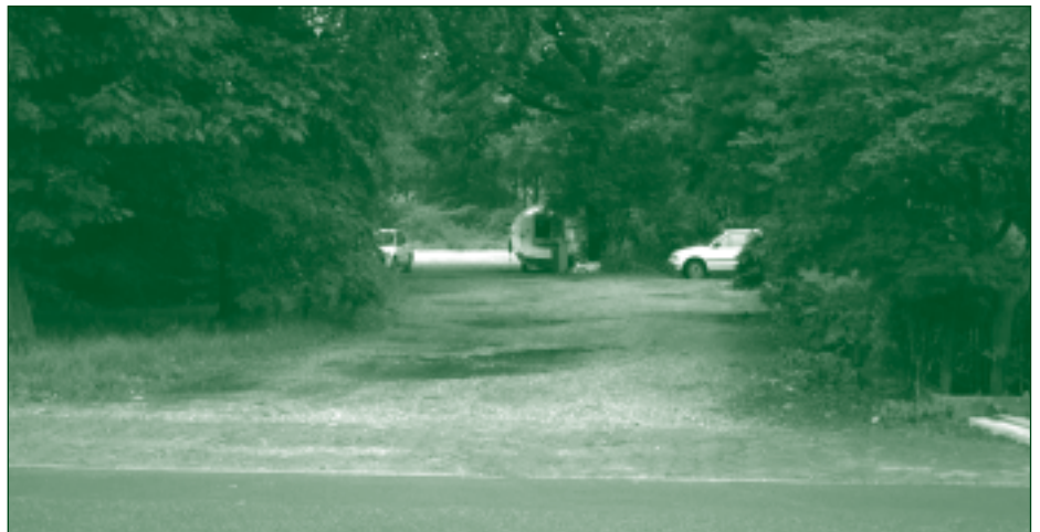
De doorgang van de Tuindorpsweg naast Groot Bloemheuvel, gezien in de richting van het spoor.

■ Uiteraard zullen wij u op de hoogte stellen van onze onderzoeksresultaten.