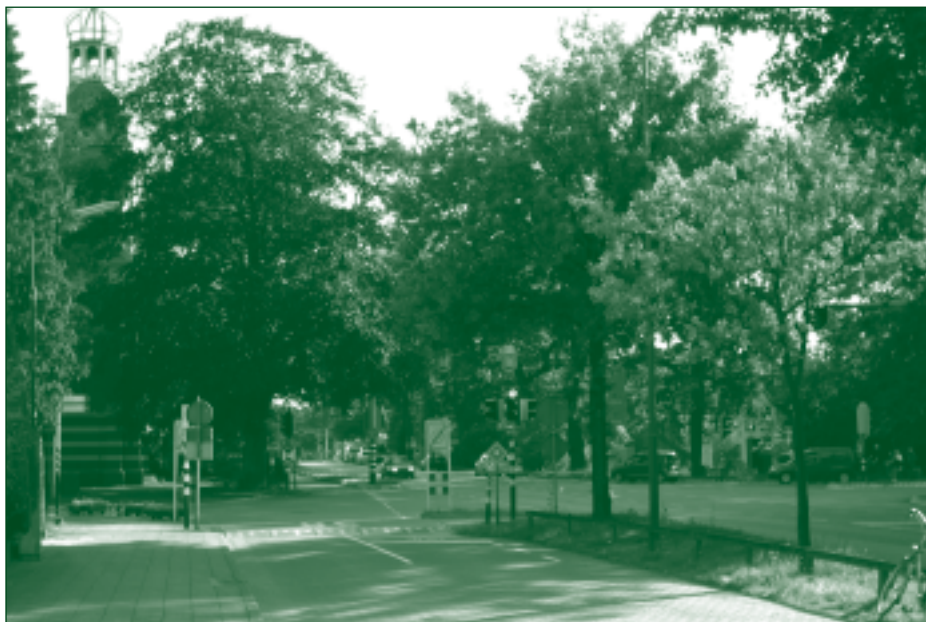
Vanaf de stoplichting op de kruising Woudenbergseweg / Haarweg / Tuindorpsweg gaat – volgens ProRail – de tunnelbak met een pittige helling onder het spoor door.

Voorlopig gaat er geen spade de grond in; genoeg tijd voor slimme oplossingen