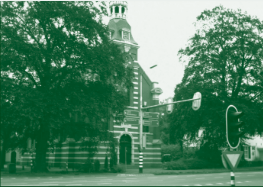
De beeldbepalende beuken dreigen het slachtoffer te worden van de tunnel.

De grote rode beuken die voor de kerk staan, zijn een grote beeldbepalende factor in het dorp Maarsbergen. Daar moeten we heel zuinig op zijn. Maar bij de voorgenomen breedte en diepte van de tunnel kan het haast niet anders dan dat bij het graven het wortelgestel van die bomen wordt aangetast. Van beuken is bekend dat zij daar heel gevoelig voor zijn.