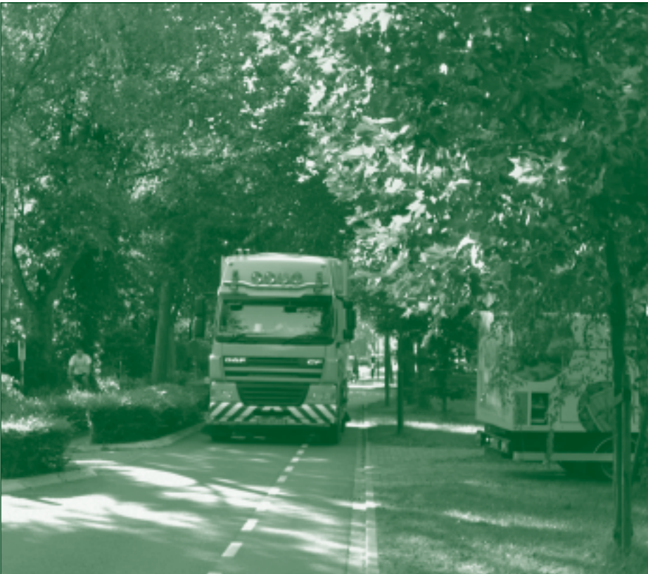
Vrachtverkeer op de Haarweg past niet bij de ruimtelijke opzet van deze woonwijk.

De Gemeente Utrechtse Heuvelrug heeft onlangs besloten om voor bedrijven uit Leersum een nieuw stukje bedrijventerrein aan te wijzen. Dat ligt tegen het bestaande bedrijventerrein in Amerongen aan. Om de daar aanwezige natuurwaarden niet te veel te verstoren, wordt het slechts een klein terrein (2ha). De gemeenteraad heeft aangedrongen op een onderzoek in de hele gemeente, om te bepalen waar toekomstige bedrijventerreinen kunnen komen.