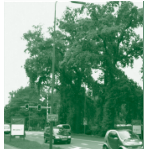
De eiken langs de Woudenbergseweg dreigen ook te sneuvelen.

ProRail is nog niet klaar met het maken van het ontwerp en dus ook niet met het uittekenen van de tijdelijke situatie. Al deze zaken zijn onderdeel van het plan van aanpak waar men op dit moment mee bezig is. Zodra e.e.a. gereed is om te worden gepubliceerd zal er ook uitvoerig over dit plan worden gecommuniceerd. Naar ons idee is het dan vanzelfsprekend om een informatieavond te