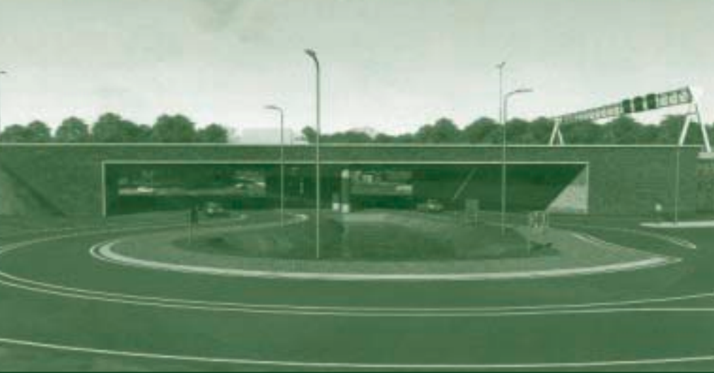
De nieuwe aansluiting Maarsbergen op de A12 gezien vanuit de richting Leersum. (De illustraties zijn afkomstig uit het Ontwerp Weg Aanpassings Besluit van Rijkswaterstaat.)