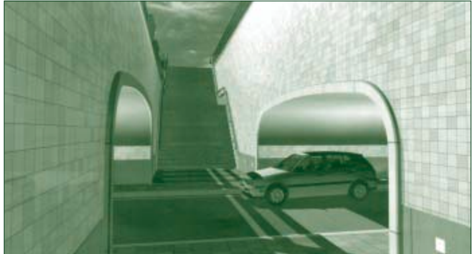
Station Maarn. Tussen de twee tunnels de nieuwe opgang naar het perron.

Start tervisielegging Ontwerp Weg Aanpassings Besluit (OWAB) Weg Aanpassings Besluit (WAB) Beroep bij Raad van State mogelijk Uitspraak Raad van State Start bouw Oplevering hele traject