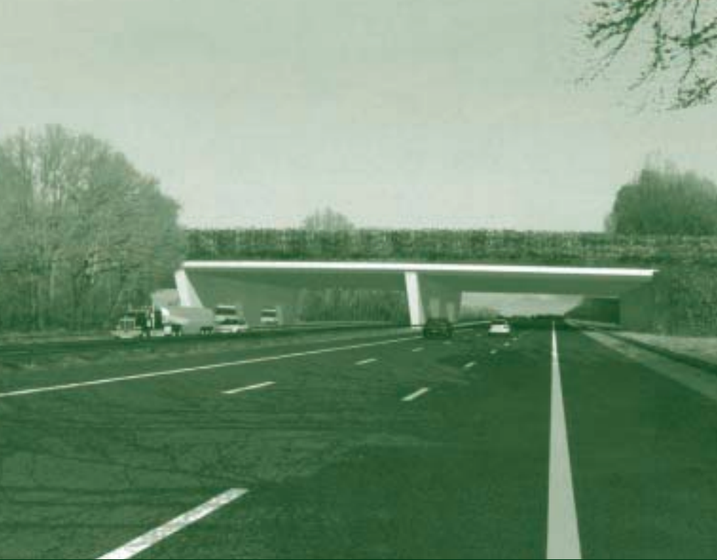
Ecoduct Mollebos, gezien vanuit Driebergen in de richting Maarn.

moet natuurlijk in goede samenwerking tussen Rijkswaterstaat, de provincie en de spoorwegen worden uitgevoerd.